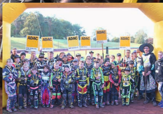
Gruppenfoto der Teilnehmenden beim SC Neuenknick

Seit rund zehn Jahren finden die Bundesendläufe im Bahnsport statt. Der Bundesendlauf in Neuenknick hat sein Ziel voll erreicht und allen Beteiligten – insbesondere den Nachwuchsfahrerinnen und Fahrern – viel Spaß am Bahnsport vermittelt!