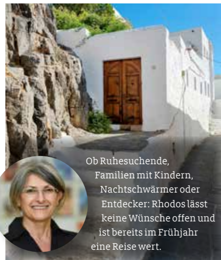
Ob Ruhesuchende, Familien mit Kindern, Nachtschwärmer oder Entdecker: Rhodos lässt keine Wünsche offen und ist bereits im Frühjahr eine Reise wert.

die Akropolis. Die Festung, eine beeindruckende 4.000-jährige Geschichte und wundervolle Ausblicke machen den Ort zu einem einzigartigen Erlebnis.