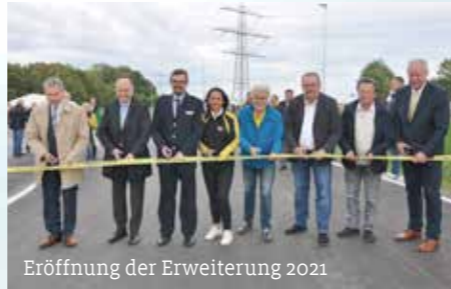
Eröffnung der Erweiterung 2021