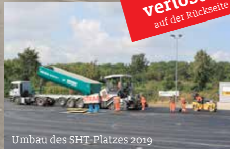
Umbau des SHT-Platzes 2019