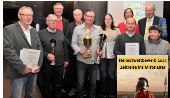
Heimatwettbewerb 2023 Zeitreise ins Mittelalter