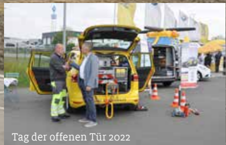
Tag der offenen Tür 2022