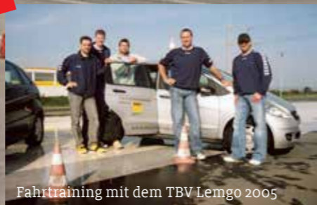
Fahrtraining mit dem TBV Lemgo 2005