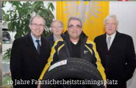
10 Jahre Fahrsicherheitstrainingsplatz