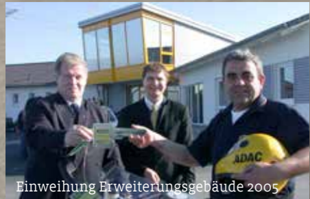
Einweihung Erweiterungsgebäude 2005