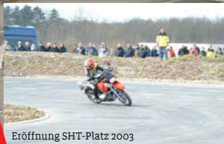
Eröffnung SHT-Platz 2003